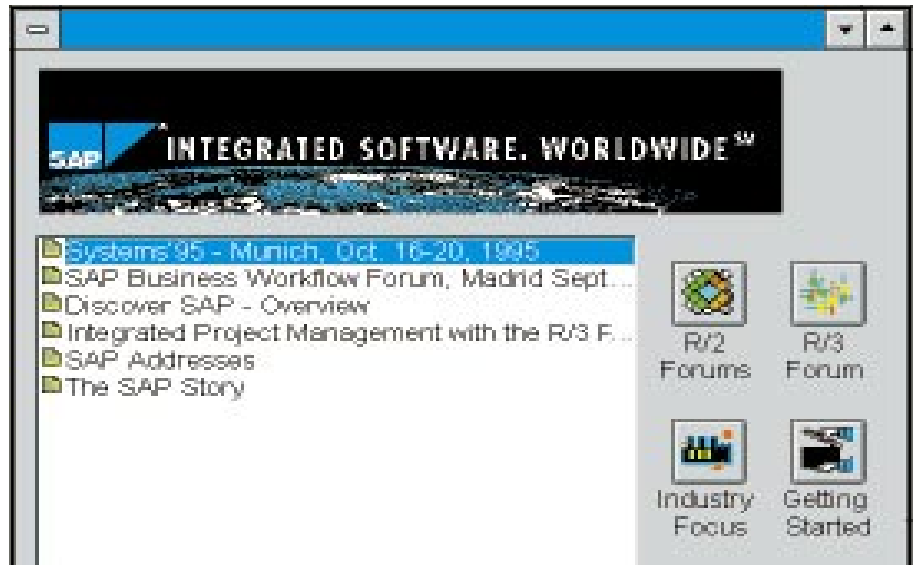
Enhanced Menu in CompuServe